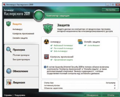
Антивирус Касперского® 2009. Главное окно программы

Новый интерфейс Антивируса Касперского® 2009 позволяет мгновенно оценить уровень безопасности системы и нейтрализовать обнаруженные угрозы несколькими кликами мыши.