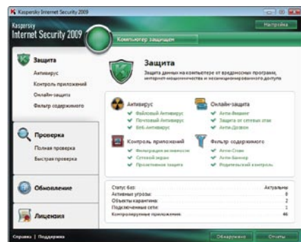
Kaspersky Internet Security 2009. Главное окно программы

Новый интерфейс Kaspersky Internet Security 2009 позволяет мгновенно оценить уровень безопасности системы и нейтрализовать обнаруженные угрозы несколькими кликами мыши.