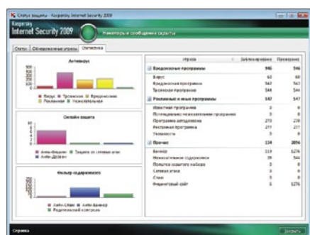
Kaspersky Internet Security 2009. Статистика