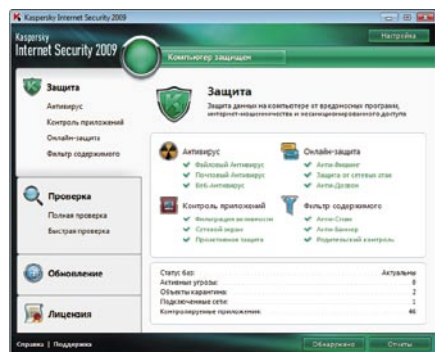
Kaspersky Internet Security 2009. Главное окно программы

Новый интерфейс Kaspersky Internet Security 2009 позволяет мгновенно оценить уровень безопасности системы и нейтрализовать обнаруженные угрозы несколькими кликами мыши.