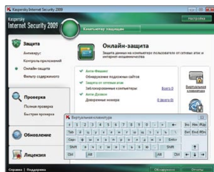
Kaspersky Internet Security 2009. Виртуальная клавиатура